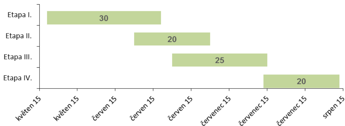
Obr. 1 Plánované aktivity jednotlivých skupin řešitelů projektu

text text text text ...a na obr.1 je zobrazen harmonogram řešení ... text text text.